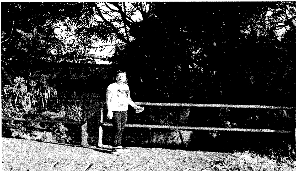
Ponte localizada na rua Tancredo Neves com cruzamento do Bairro São João